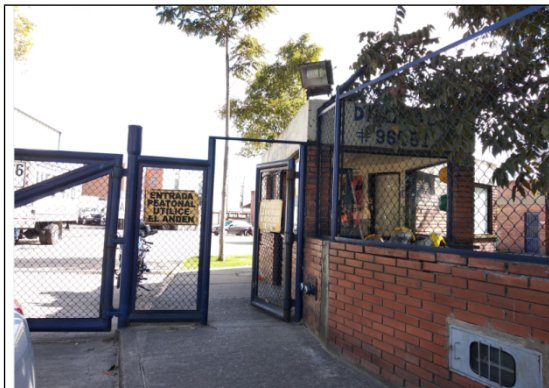
No. 1. Vista general del predio