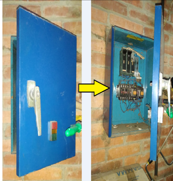
Foto No. 4. Sistema eléctrico deshabilitado