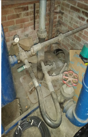
Foto No. 3. Vista general del pozo