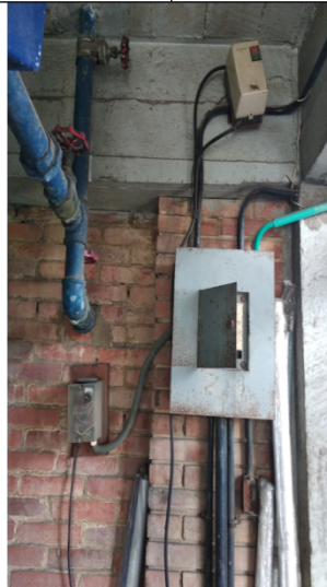
Foto No. 5. Sistema de producción, válvulas fuera de funcionamiento