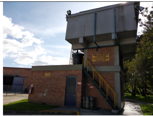
Foto No. 2. Ubicación del pozo en el predio