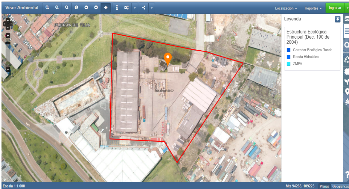
Imagen 2. Ubicación cartográfica del pozo

Mediante la herramienta del VISOR GEOGRÁFICO AMBIENTAL y SINUPOT, se verifica que el predio identificado con CHIP AAA0169KBBS, donde se ubica el pozo con código pz-09-0061, no se encuentra afectado por las zonas correspondientes a Corredor Ecológico, Ronda Hidráulica y ZMPA, establecidas en el Decreto 190 de 2004. A continuación, se presenta la ubicación cartográfica del pozo en mención (Imagen 2).